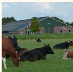
Natuurboerderij de Mhene