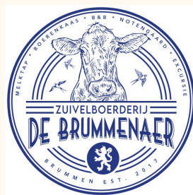
Zuivelboerderij De Brummenaer