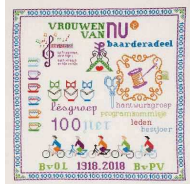
Handwerk, vorig jaar gemaakt door de afdeling Baarderadeel (Mantung e.o.), ter ere van hun 100-jarig bestaan.

„Wat wij doen, vinden ze interessant, maar deze generatie wordt geen lid meer van een vereniging.“ Daarvoor heeft Vrouwen van Nu een oplossing. De vereniging wil de kant op van netwerken. Die moeten zich vormen rond maatschappelijke thema's. Daarvan zijn er al een aantal benoemd, zoals duurzaamheid, stad en platteland, generatieleraanpak en diversiteit. „Ons verenigingskantoor fungeert daarbij als servicebureau. Wij helpen bijvoorbeeld bij het oprichten van zo'n netwerk. Zo zorg je voor continuïteit.“