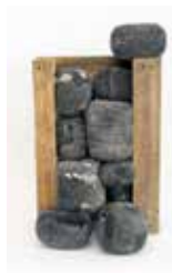
SterkSteen Hilly Binksmas