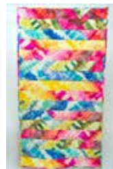
Kleurrijke verrassing Liesbeth Ouwerkerk

De expositie is te bezichtigen van 31 mei tot en met 26 augustus 2018.