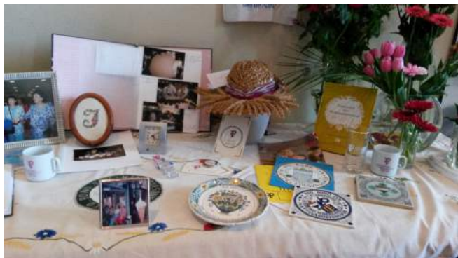
Verskillende herinnerings artikelen

Afd. Moerkapelle vierde haar 75 (+2) verjaardag in Dorps-huis Op Moer. De leden werden verrast met een feestelijk walking dinner en werden er herinneringen opgehaald.