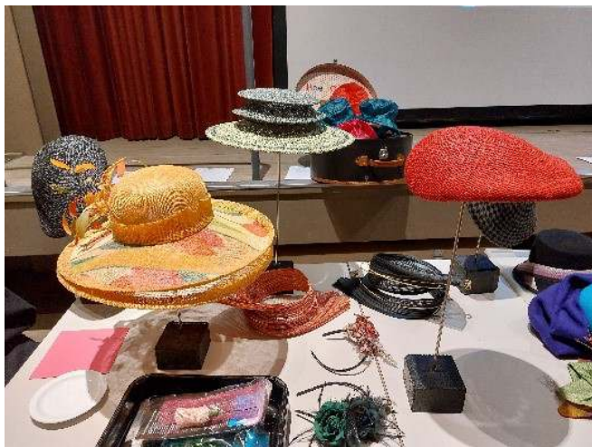
Hoedje op, hoedje af bij afdeling Ulvenhout.