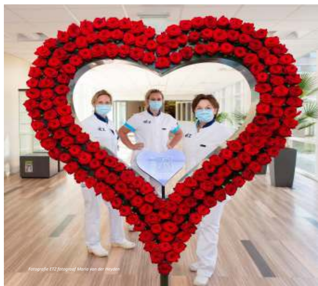
Fotografie ETZ, foto: Maria van der Heyden

Kring Tilburg: Elisabeth Ziekenhuis in Tilburg