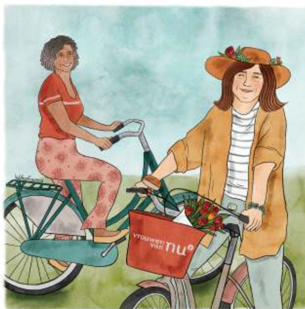
fietsen in de zomer