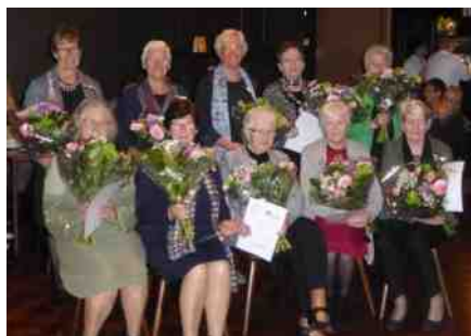
10 x 50

Net als in andere jaren zijn er dit jaar bij veel afdelingen jubilarissen. Ook zijn er afdelingen die zelf een jubileum vieren. Zo kreeg ik een bericht van de afdeling Klein Zundert , opgericht op 3 december 1968 als Boerinnenbond. De afdeling be-