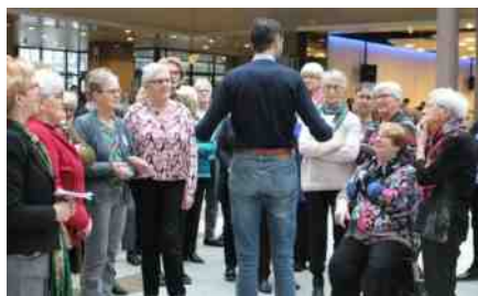
tweede kamer bezoek