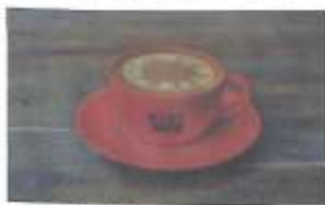
Kopje koffie kunnen drinken.

Wij wensen jullie allemaal een heel fijne zomer en hopelijk tot gauw, zodat we weer gezellig samen een