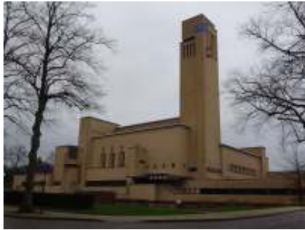
Raadhuis van Hilversum