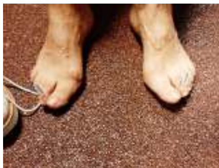
Naalden in de voeten