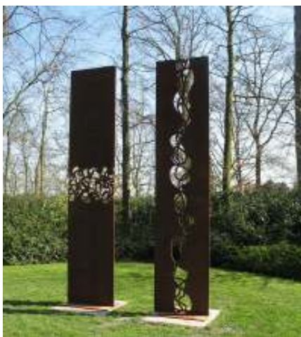
Kunstwerk van Cyril Lixenberg