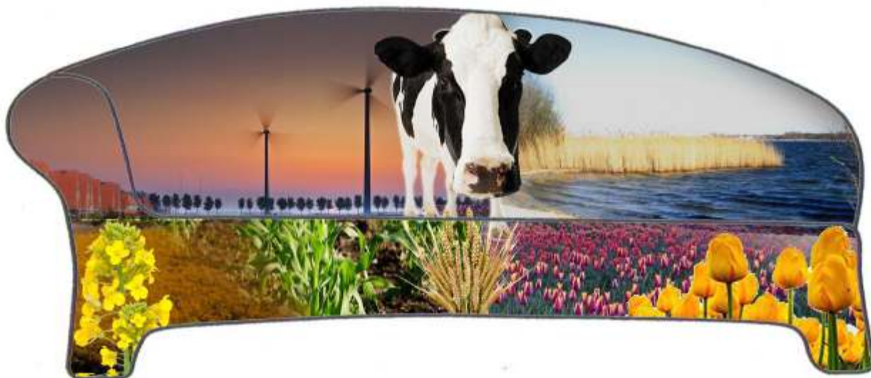
Ontwerp vooraanzicht Social Sofa