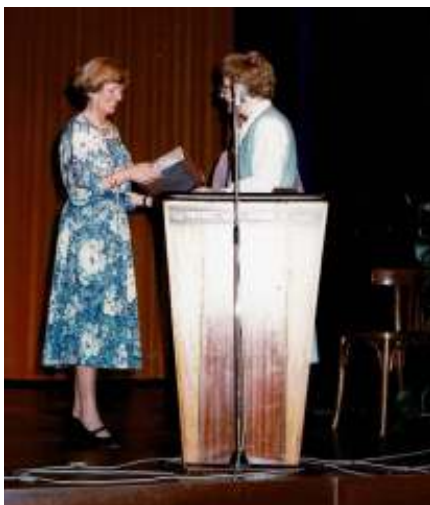
25 jaar secretaresse NBVP Zeeland

In de beginperiode ging ze met haar "woonkoffer" de afdelingen langs om