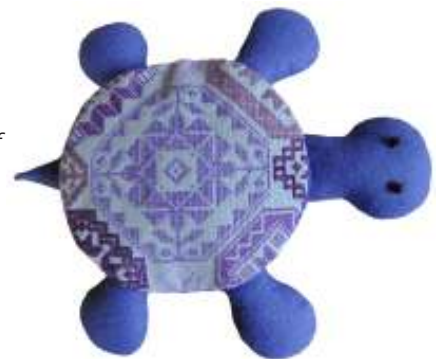
Schilpad Quakermotief

opgave via email: cursussenkhtw@gmail.com