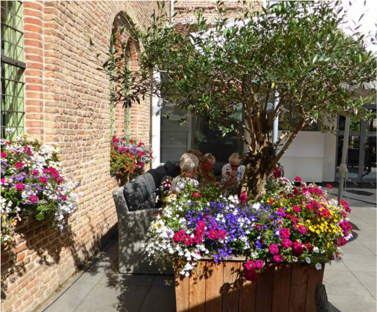
Even pauze tijdens de stadswandeling in Amersfoort

De commissie Cultuur wil leden van Vrouwen van Nu mogelijkheden aanreiken om actief en/of passief bezig te zijn met diverse vormen van cultuur. Daartoe worden allerlei activiteiten op cultureel gebied georganiseerd. Zo organiseren zij jaarlijks dansdagen in Rolde en Ruinerwold en een zangmiddag in Westerbork. Alsmede culturele excursies naar boeiende steden en aan het eind van het jaar een Kerst-Inn.