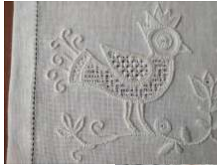
Schwalmisch wit borduurwerk

opgave via email: cursussenkhtw@gmail.com