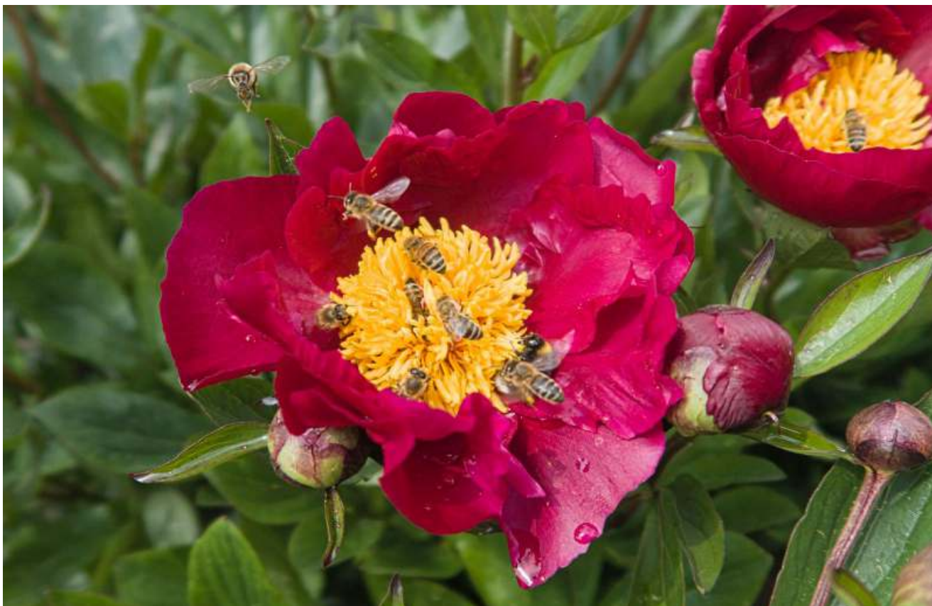
Zijn het de zoomende of zoemende bijen?