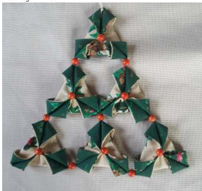
werkstuk Vouwen en Plooien

Lees verder over het digitale avontuur op de volgende bladzijde.