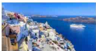
Maak kennis met het echte Kreta

Baltisch Staten 11 daagse vlieg-/busreis 12 t/m 22 september