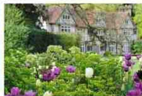
Tuinenreis in Sussex Zuid-Engeland