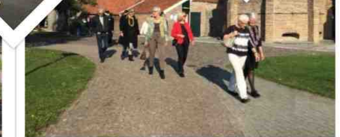
Collage van Pauperparadijs, foto gemaakt door Janny Prins.