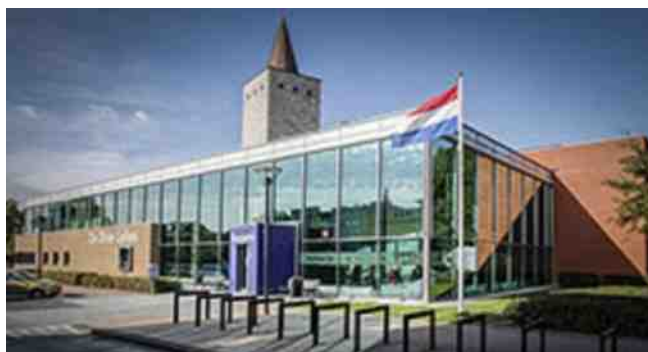
De 3 Lelies in Puttershoek

Deze bijeenkomst kan worden bezocht door alle zuidhollandse leden. Gezien het thema wordt aller aanwezigheid ook zeer op prijs gesteld! De agenda met de bijbehorende stukken worden t.z.t. naar de afdelingen gestuurd. Vraag je eigen afdelingsbestuur nadere informatie als je deze bijeenkomst wilt bijwonen.