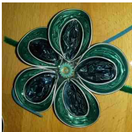
broche van koffiecups