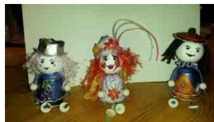
Poppetjes van koffiecups