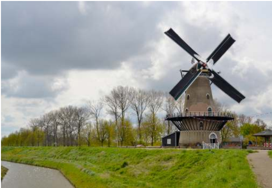
Molen de Korenbloem in Kortgene

Via Wissenkerke reden we richting Seafarm, waar Aly Wisse ons o.a. vertelde over Camperwind, een coöperatie van 14 Noord-Bevelandse boeren die 4 windmolens exploiteren.