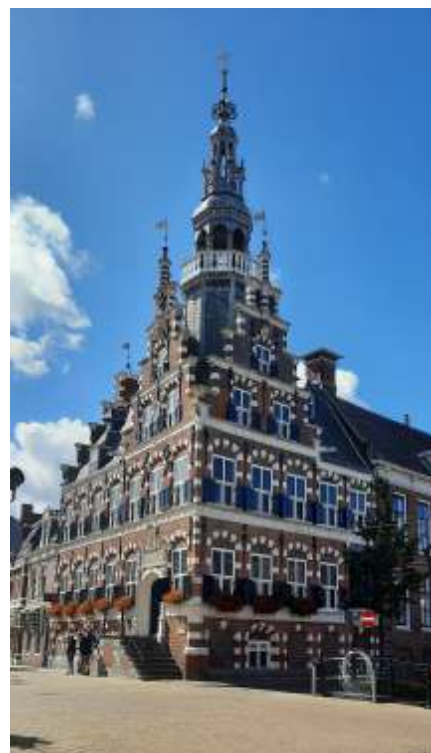
Het stadhuis van Franeker

De Hanzestad groeide en bloeide destijds door haar unieke ligging, maar door verzanding en overstroming raakte ze de handel kwijt. Maar Stavoren richtte zich weer op tot een levendig stadje met visserij en tegenwoordig veel toerisme.