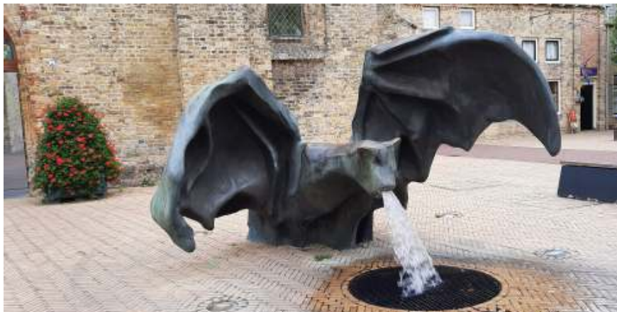
Fontein de Vleermuis in Bolsward

De fontein bevindt zich vlakbij het station, een levensgroot beeld van een jongen en meisje, dromerig voor zich uit staand, alsof ze van een mooie toekomst dromen, het beeld wordt de "Love Fontein" genoemd. Geen spuitend water hier maar nevel, geïnspireerd op de nevel, die soms over de weilanden hangt en koeien laat zweven. Dit beeld bleef de kunstenaar bij toen hij met Friesland kennis maakte. We zoeken een rondvaartboot en maken een fantastische tocht over grachten en grote waterpartijen rond Leeuwarden en luisteren naar de verhalen van de gids.