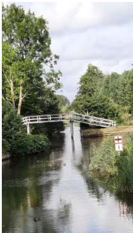
't beroemde bruggetje van Bartlehiem...

De dag erop fietsen we naar Sneek, de stad van het skûtsjesilen en de Sneekweek. Vlak voor de waterpoort staat de fontein van "Fortuna" op het water. Een draaiende gouden bol waarop de man de hoorn van overvloed draagt. Veel uitgaansmogelijkheden hier, veel terrassen en boten, een stad groot geworden door de watersport. Rondvaarten -zowel door de stad als daarbuiten over de vele meren- zijn mogelijk.