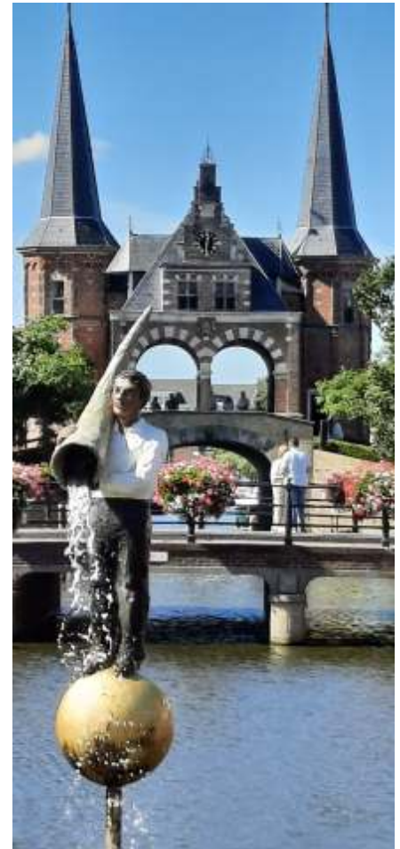
Fontein Fortuna in Sneek