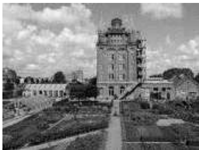
Villa Augustus met koffie/thee.

Jullie worden ontvangen om 11.30 uur bij